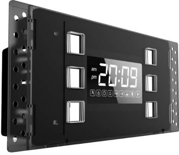
Dora Style M200 Glass