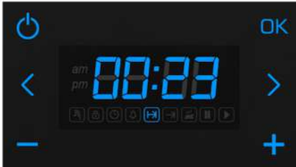
Pişirme süresi kalan değer

"OK" butonuna basılarak fırın çalıştırılır. Ekranda güncel saat ile pişirme süresi dönüşümlü olarak gösterilir. "G" ikonu yanıyorken güncel saat değeri, "H" ikonu yanıyorken pişirme süresinin kalan değeri gösterilir. Pişirme süresi sonunda ise fırın kesici ile durdurulur ve sesli uyarı verilir.