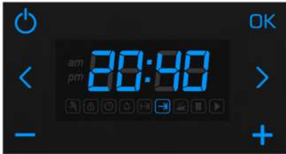
Pişirme süresinin bitiş değeri

"OK" butonuna basılarak ötelenmiş pişirme başlatılır. Ekranda güncel saat ile pişirme bitiş zamanı dönüşümlü olarak gösterilir. "⌚" ikonu yanıyorken güncel saat değeri, "⏸" ikonu yanıyorken pişirme bitiş zamanı gösterilir.