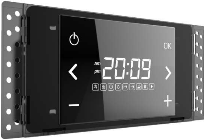
Dora Style M200 Inox