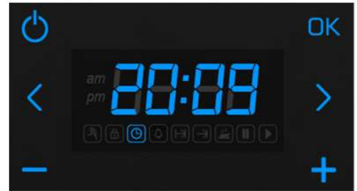
Anlık saat değeri

Alarm süresi sonunda sesli uyarı verilir. Herhangi bir butona basılarak sesli uyarı susturulur. Alarm kuruluyken veya çalarken fırın fonksiyonu çalışmaya devam eder.