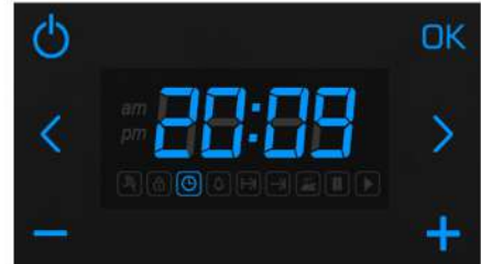
Anlık saat değeri

Ekranda "H" ikonu yanıp sönmeye başlar. Herhangi bir butona basılarak sesli uyarı susturulur ve bekleme ekranına dönülür. Pişirme süresi sona ermeden önce fırını durdurmak ve çalışan programı iptal etmek için "G" butonuna uzun basılır.