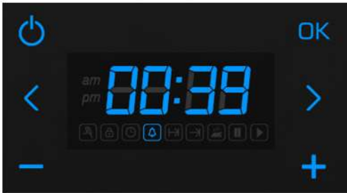
Kalan alarm süresi

“ ⌚ ” ikonu yanıyorken güncel saat değeri, “ 🔔 ” ikonu yanıyorken kalan alarm süresi ekranda gösterilir.